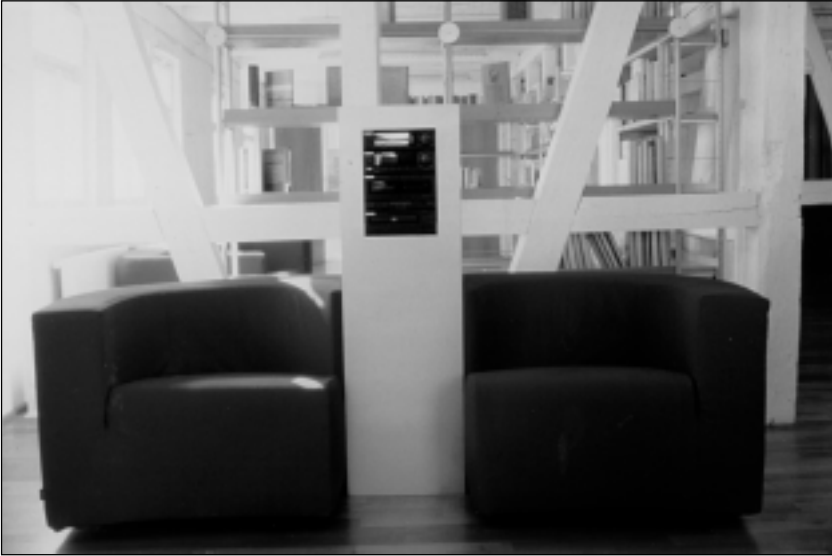
7 Doppel-„Hörstation“ in der Jugendbibliothek zum gemeinsamen Anhören von CDs per Kopfhörer.