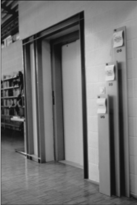
3 Der „mit einem Pin angeheftete Zettel“ zieht sich als Leitmotiv durch das ganze Gebäude. Hier das Beispiel für Stockwerkhinweise am Aufzug.