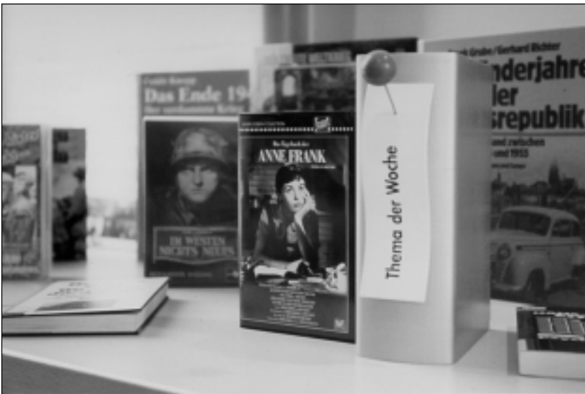
4 Variables „Buch-Element“ mit „Thema des Monats“, beliebig im Regal zu positionieren.