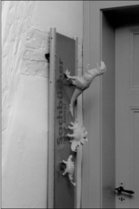
5 Dinosaurier führen zu den Sachbüchern für Kinder ab 8 Jahren.