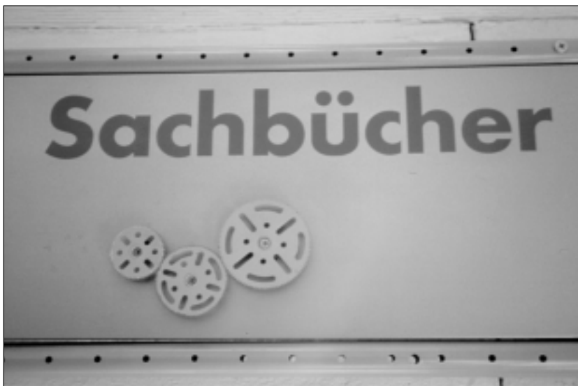
6 „Vergegenständlichtes“ Leitsystem für die Kinder- und Jugendbibliothek.