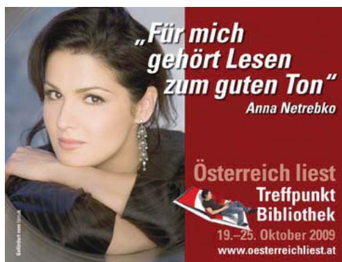
► Inserat mit Anna Netrebko, 2009