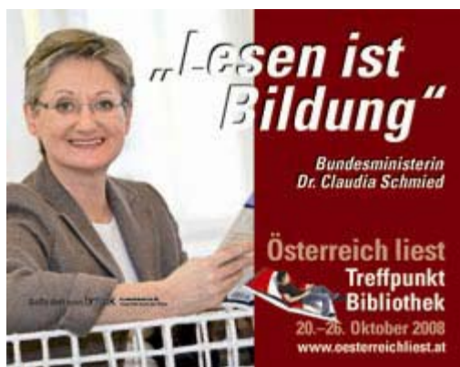
► Inserat mit BM Dr. Claudia Schmied, 2008