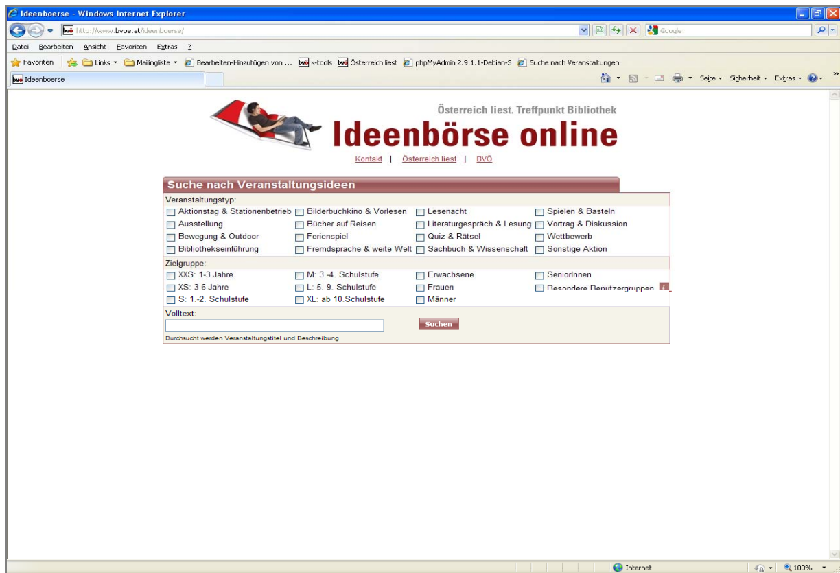
► Suchmaske der „Ideenbörse online“

Unter www.bvoe.at/ideenboerse ist die Datenbank seit Anfang Mai online. Interessierte können mit tollen Suchfunktionen Veranstaltungskonzepte suchen.