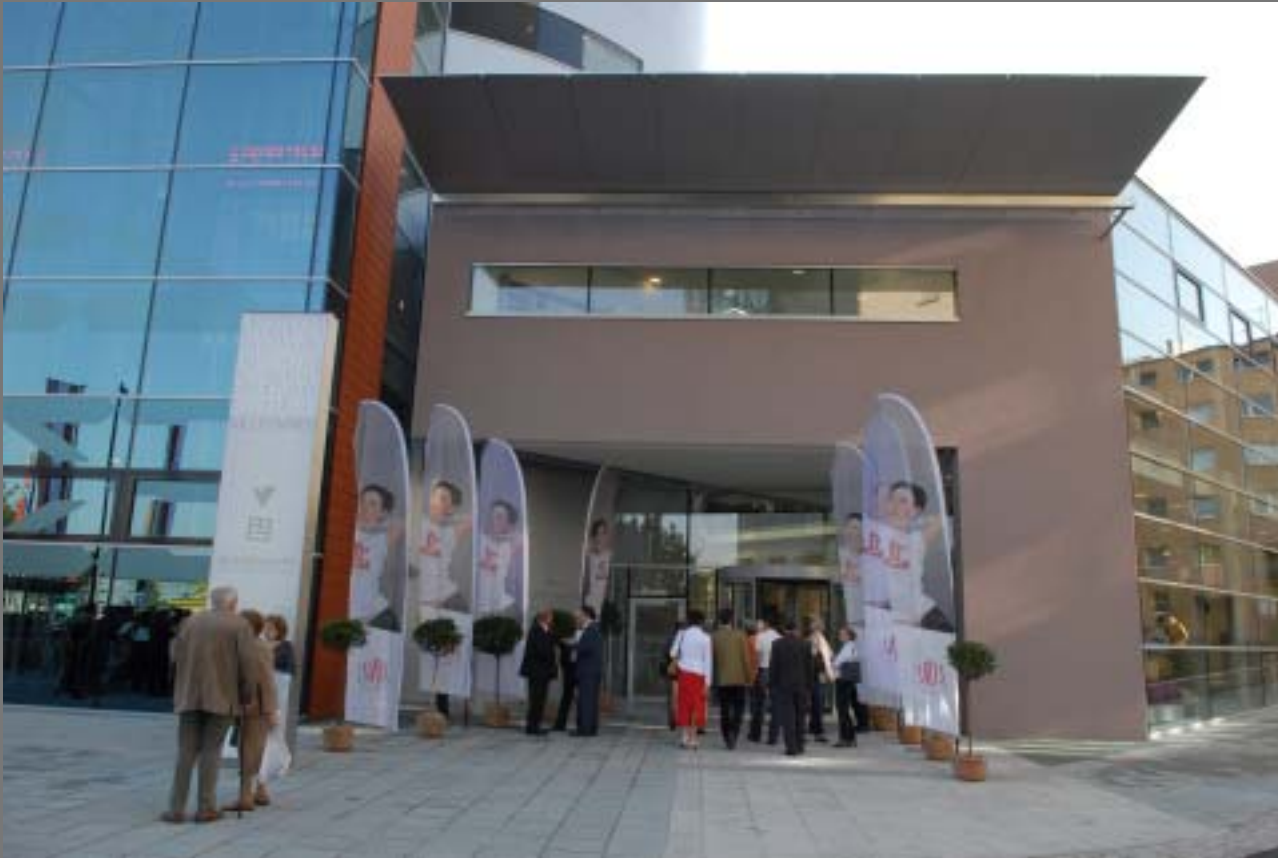
Volkshochschule - Stadtbibliothek Linz