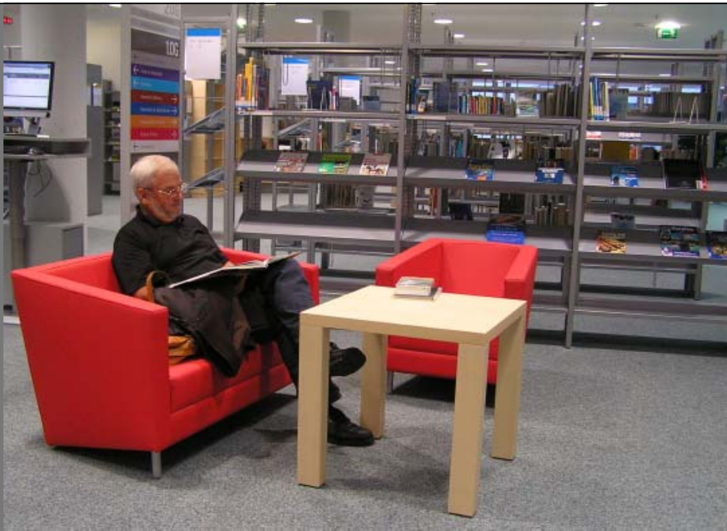
Volkshochschule - Stadtbibliothek Linz