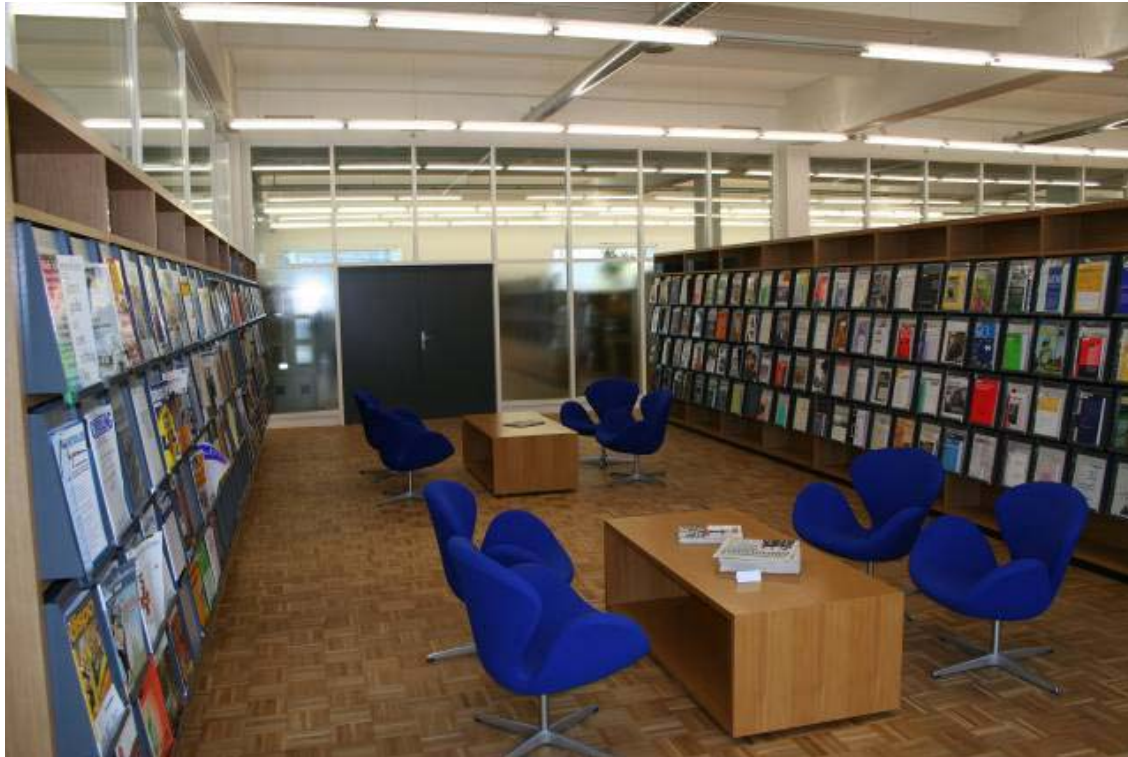
Fachhochschule Vorarlberg Bibliothek in Dornbirn