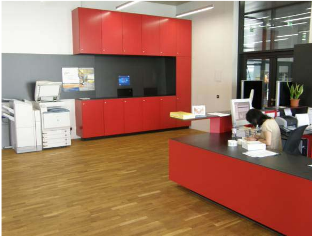
Eingangsbereich / Selbstverbucher